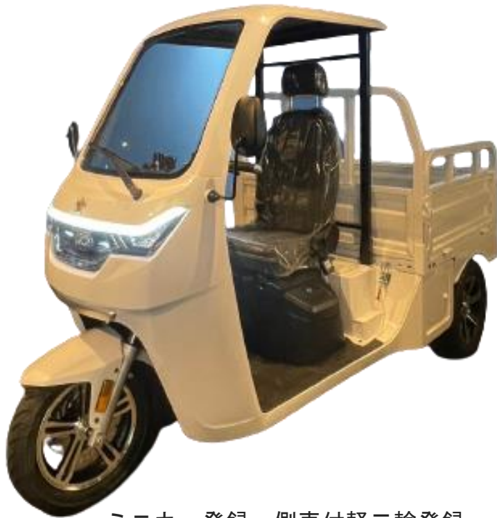
ミニカー登録・側車付軽二輪登録